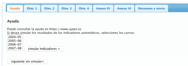
Figura 4: Vista de la pantalla de simulación

El /la solicitante antes de comenzar a completar la solicitud, podrá simular los valores de los indicadores de cálculo automático para diferentes periodos de evaluación, de modo que opte por la opción temporal más adecuada para su solicitud de evaluación.