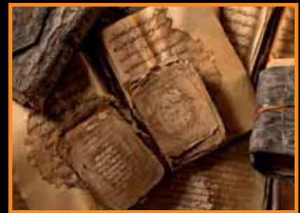
FONDO KATI. ¿Negocio de la memoria?