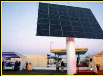
SUN TOWER: energía solar para la agroindustria

ACTUALIDAD UNIVERSITARIA Y DIVULGACIÓN CIENTÍFICA WWW.NOVACIENCIA.ES | PVP. 2€ UNIVERSIDADES DE ALMERÍA, GRANADA, JAÉN, MURCIA Y UCAM