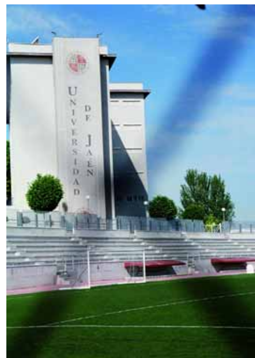
Uno de los campos en los que la Universidad de Jaén está muy comprometida es en la conservación de su inmenso y rico patrimonio histórico. Arriba, participación en la Semana de la Ciencia, entrega del II Premio Castillo de Canena e instalaciones deportivas de primer nivel.

El último objetivo expresado en el Plan hace referencia a avanzar en la estrategia de gestión de la calidad de la Universidad, con un plan de calidad y la posibilidad de participar en la convocatoria de planes y proyectos que “incidan en la excelencia universitaria”. Con esta serie de objetivos, la Universidad de Jaén aspira a revitalizar culturalmente la provincia en la que actúa al mismo tiempo que devuelve parte de lo que recibe de ésta, con una política de transparencia y rendición de cuentas. ■