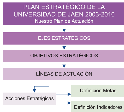
Figura 1. Despliegue del plan estratégico

Dicho nivel de ejecución se ha obtenido a partir del nivel de desarrollo de los distintos elementos que conforman el despliegue del Plan Estratégico (Figura 1). Como se aprecia en esta figura, el nivel de cumplimiento de las acciones estratégicas es el que determina el nivel de desarrollo de las líneas de actuación. A su vez, este nivel de desarrollo es el que permite valorar el grado de consecución de los objetivos estratégicos, lo que, a su vez, determina el grado de avance en los ejes estratégicos. Por último, este grado de avance en los ejes es lo que determina el nivel de ejecución del Plan Estratégico.