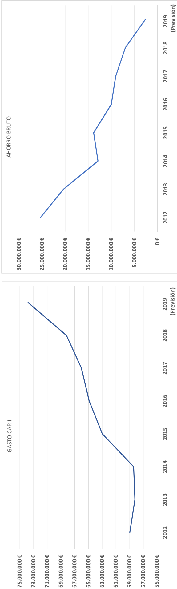
CUADRO 7. COMPARATIVA DEL CAPÍTULO PRIMERO DEL ESTADO DE GASTOS (GASTOS DE PERSONAL) VERSUS AHORRO BRUTO