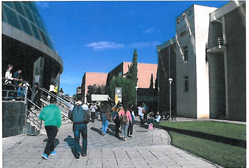
Campus universitario de Las Lagunillas en la capital. VIVA JAÉN

mental" sobre las necesidades del tejido empresarial y las posibilidades que ofrece la institución académica, que es "la mayor empresa de la provincia". La Fundación estará constituida por empresarios de los distintos sectores productivos de la provincia y miembros de la Universidad. "Los empresarios podrán conocer cómo trabaja la Universidad y ésta qué necesidades tiene el sector productivo de la provincia", dijo, para de esta manera formar en la institución académica a universitarios que serán empleados en el tejido empresarial de la provincia. Así, se evitarán situaciones repetidas hasta el momento, en la que a pesar de la formación de los egresados, en la provincia hay puestos sin ocupar porque no se han formado en la materia que las empresas reclaman. "Tenemos necesidad de puestos de trabajo que no están cubiertos. En la empresa privada hemos tenido que formar a personas en tema de logística, por ejemplo", asegura el empresario como director