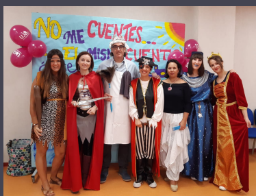
Participación en la Noche Europea de I@s Investigador@s en 2019

A quienes empecéis esta andadura, os animo a preparar sin prisas vuestro equipaje. Todo lo que dediquéis a documentaros, formaros y diseñar con detalle el proyecto os evitará pasar malos ratos y será un tiempo muy bien invertido. A quienes ya estéis en marcha o finalizando ¿qué os voy a contar? Pensad que siempre hay luz al final del túnel.